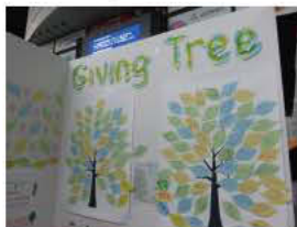
ボランティアアワード2017のGiving Treeの様子

多くの人が寄付に対する思いを木にする、という活動。葉っぱに寄付の思いを書いてもらう ・寄付をした時に感じる気持ち ・寄付の経験 ・寄付を広めるためのアイデア